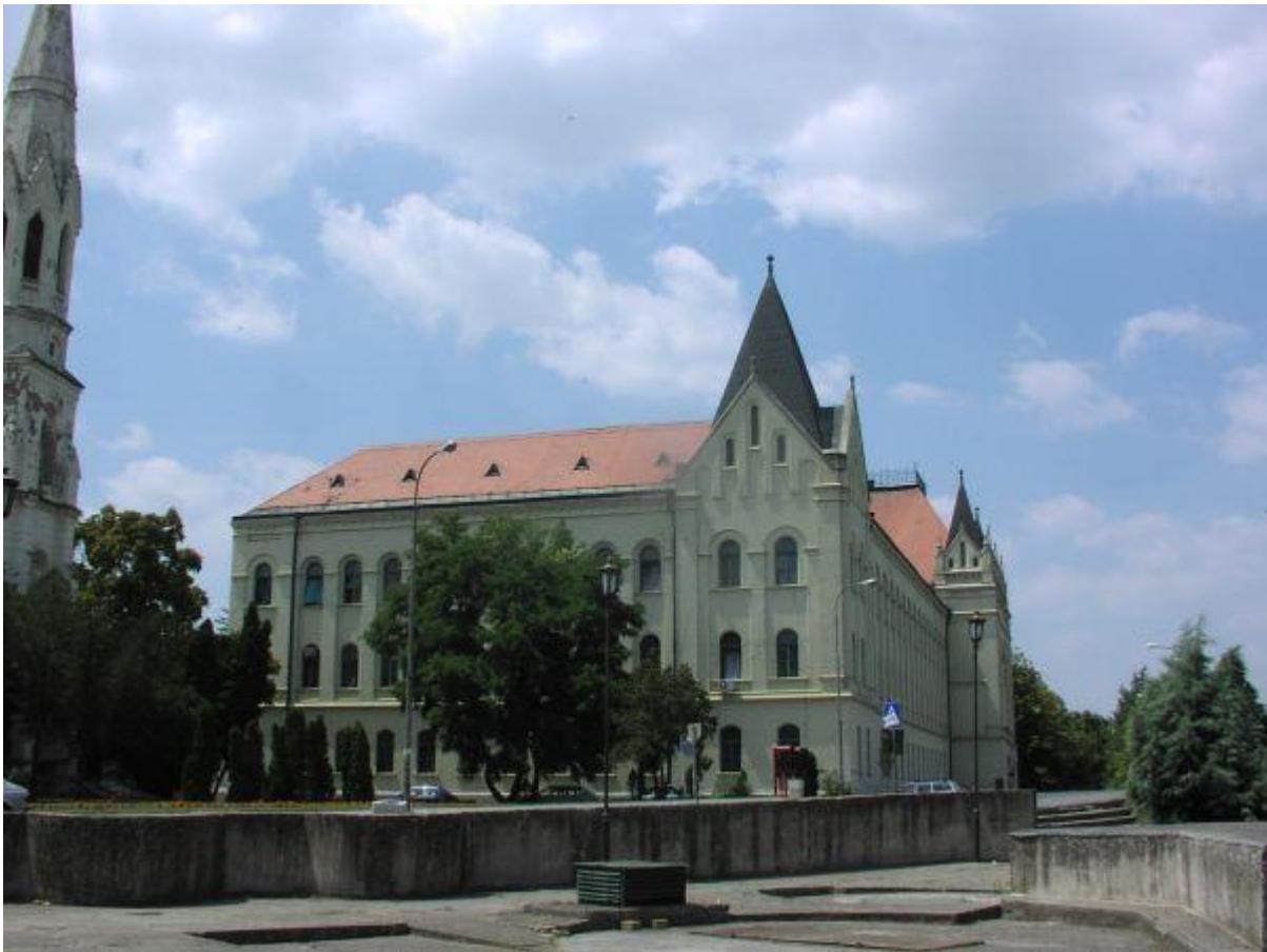
Зграда правосудних органа у Зрењанину, Кеј 2. октобра бр. 1